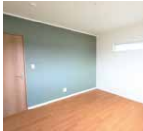
▲落ち着いたグリーンのカrossをアクセントにした寝室。落ち着いた雰囲気。