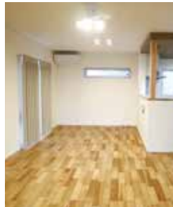
▲木目の濃淡が美しいフローリング。