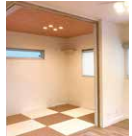
▲ブラウン×ベージュの市松模様の和室はリビングにも馴染み一体感のある空間に。

▼ホーロー製のキッチン。耐久性に優れ汚れもつきにくい。ガラスコーティングが美しく清潔感あふれる。